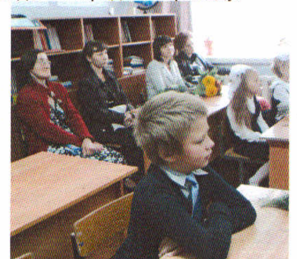
Родители и обучающиеся 1-3 классов на Уроке Мира и Добра