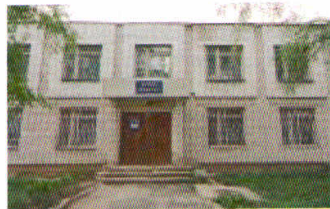
Детская библиотека Филиал РМУК «Кашинская межпоселенческая центральная библиотека» г. Кашин

С 17 сентября в г.Кашин начала работать объединённая выставка изобразительного и декоративно-прикладного творчества «Я родину люблю!». Выставка представлена творческим коллективом МОУ «Вепревская ООШ им. Ф.В. Морины» и объединяет образовательные учреждения и учреждения культуры из 3-х близлежащих районов: Сонковский, Бежецкий и Краснохолмский