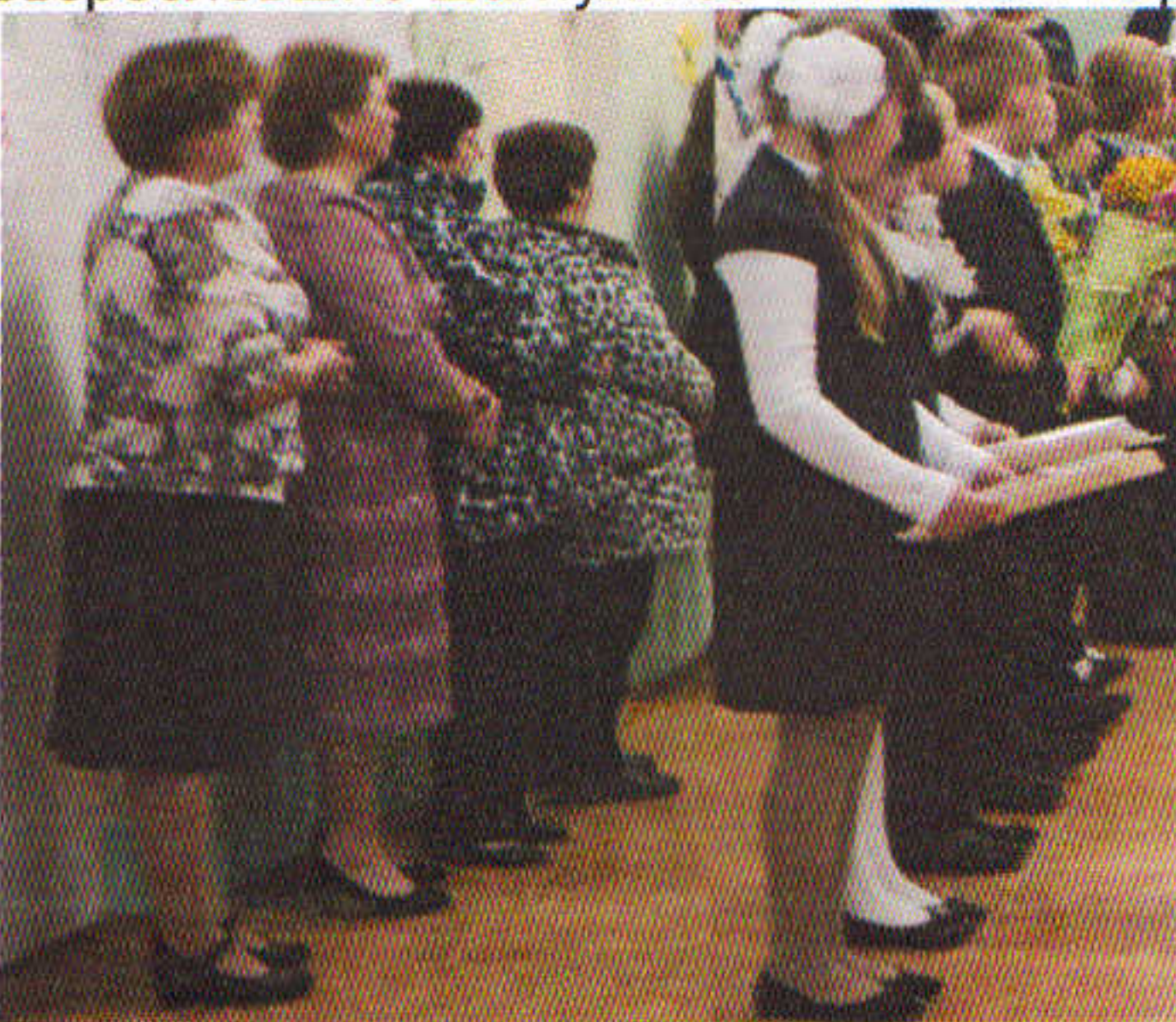
На торжественной линейке 1 сентября

Эти замечательные слова можно отнести в полной мере не только к учителю, но и к школе. Для школы нет старых и новых учеников, все ученики, когда бы они не закончили школу – ее дети. И школа помнит всех, помнит их имена, помнит их шалости и успехи. Помнит как впервые волнуясь они переступали ее порог, а потом, повзрослевшие шагнули за школьный порог в большую жизнь. Школа встречает своих детей и рада их приходу.